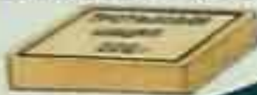
Шашка массой 200 г