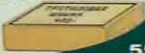
Шашка массой 400 г