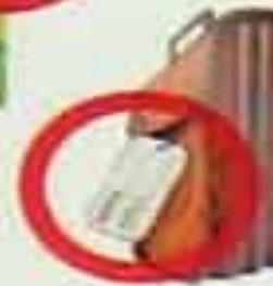
БЕСХОЗНЫЕ СУМКИ, ПОРТФЕЛИ, ПАКЕТЫ